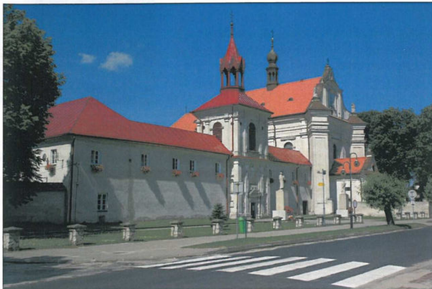
Sanktuarium Nawiedzenia Najświętszej Marii Panny w Krasnobrodzie