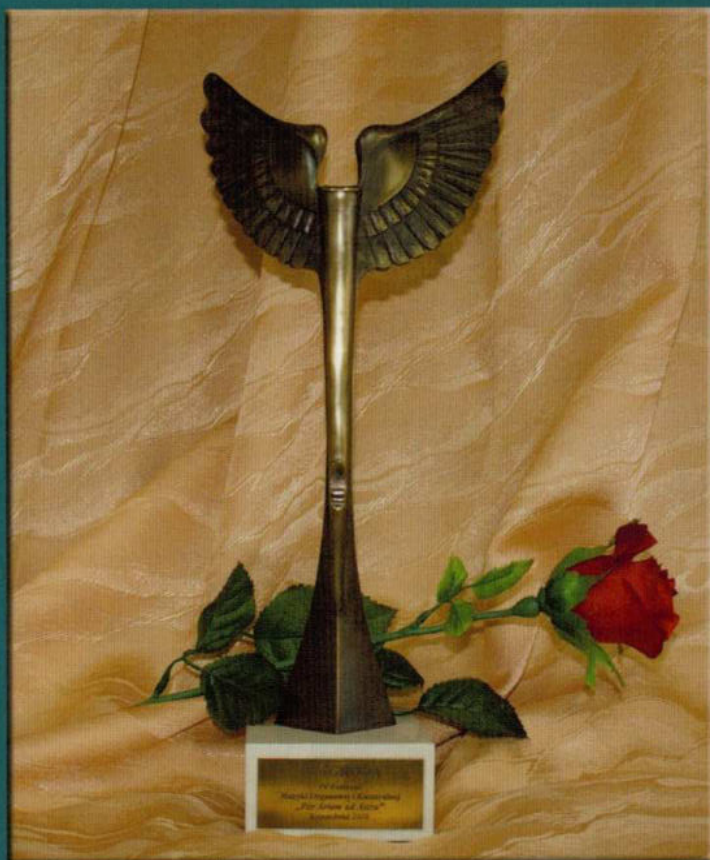
I Nagroda V Festiwal Muzyki Organowej i Kameralnej „Per Artem ad Astra” Krasnobród 2011