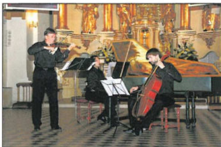
Zespół Altri Stromenti