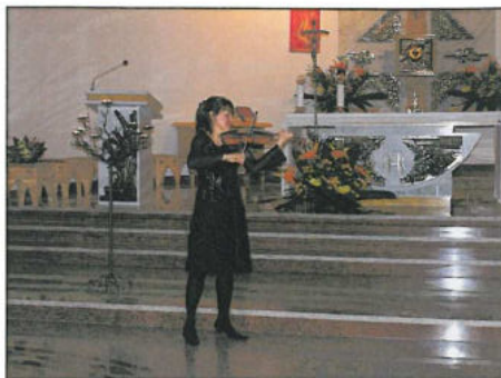
Koncert w Kościele Zstąpienia Ducha Świętego