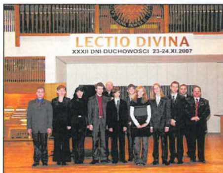
Aula Katolickiego Uniwersytetu Jana Pawła II w Lublinie