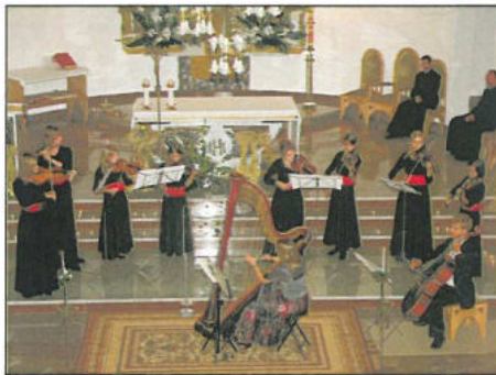
Koncert w Kościele Zesłania Ducha Świętego