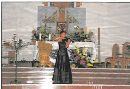
Koncert w Kościele Zesłania Ducha Świętego