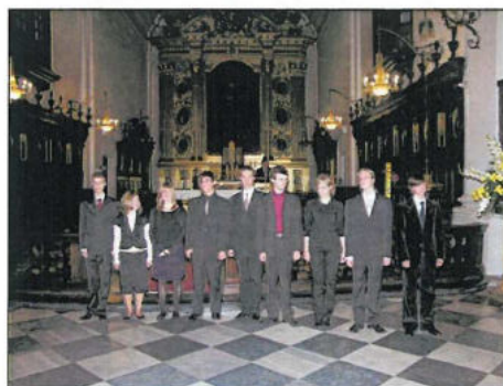
Bazylika Świętego Krzyża w Warszawie